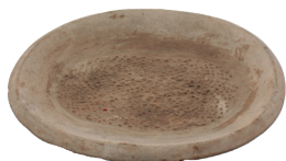
Plato ovalado empleado como rayador. Cultura La Tolita-Tumaco (600 a. C. – 400 d. C.) N° de inventario: AAM 00089.2.27 Terracota Proveniencia: sin información.