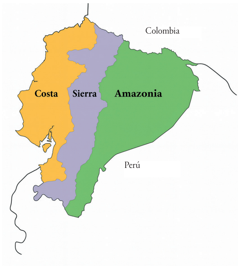
Mapa de las tres regiones naturales de la República del Ecuador