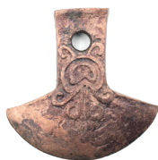
Hacha con decoraciones en espiral Cultura Cañari (700 a. C. – 1532 d. C.), periodo de integración (700-1450 d. C.) N° de inventario: AAM 05177 Aleación de cobre Proveniencia: Alausí, Provincia de Chimborazo