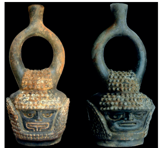
Vasija con asa y cuello en forma de estribo Mayo Chinchipe Marañón

La cultura Mayo Chinchipe Marañón, de la que procede el original de este recipiente descubierto en el yacimiento de Santa Ana La Florida (SALF), se encuentra en la provincia de Zamora Chinchipe, en la región sur oriental del Ecuador. El yacimiento de Santa Ana La Florida, estudiado por Francisco Valdez y su equipo, se encuentra en una terraza fluvial de aproximadamente una hectárea transformada artificialmente por sus antiguos ocupantes. Además de restos arquitectónicos, se han descubierto objetos de piedra, conchas marinas y cerámica. Entre ellos se encuentran objetos de arte lapidario (objetos de piedra pulida y adornos de turquesa y malaquita).