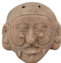
Pendiente/máscara Cultura La Tolita-Tumaco (600 a. C. – 400 d.C.) N° de inventario: AAM 00049.7 Terracota Proveniencia: sin información.