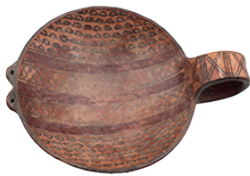
Puku , plato con motivos geométricos. Cultura Inca (1450 – 1532 d. C.) N° de inventario: AAM 05472 Terracota. Proveniencia: Latacunga, Cotopaxi.