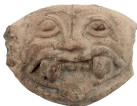
Pendiente/máscara con rasgos felinos Cultura La Tolita-Tumaco (600 a. C. - 400 d. C.) N° de inventario: AAM 00073.15 Terracota Proveniencia: sin información.