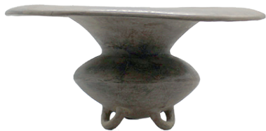
Vasija trípode con borde ancho. Cultura Manteña (800-1532 DC) N° de inventario: AAM 00091.1.1 Terracota. Proveniencia: sin información.

La cultura Manteña floreció en la costa centro-norte de Ecuador durante la época de la Integración (800-1532 d. C.). Su organización se caracterizaba por un sistema de señoríos —entidades territoriales— dirigidos por poderosos caciques . El período anterior, el Desarrollo regional, se caracterizó por el papel de líderes religiosos y el chamanismo, ampliamente representados en la iconografía. En la época de la Integración, el poder evolucionó hacia una autoridad más civil y política, encarnada por los caciques. Esta cultura marítima desarrolló amplias redes comerciales y florecientes actividades mercantiles, al tiempo que se garantizaba el acceso a los recursos de las diferentes zonas ecológicas. Los descubrimientos de suntuosas tumbas de linajes de comerciantes dan testimonio de la riqueza de algunos individuos.