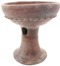
Copa con pedestal. Cultura Puruhá (300 – 1500 DC) N° de inventario: AAM 05205 Terracota. Proveniencia: sin información.