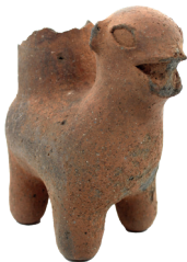
Vasija en forma de cuadrúpedo. Cultura Puruhá (300 – AD 1500) N° de inventario: AAM 05208 Terracota. Proveniencia: Machachi, Pichincha