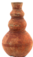
Botella trilobulada. Cultura Cañari (700 a. C. – 1532 d. C.), fase Tacalshapa (700 a. C. – 1100 d. C.) N° de inventario: AAM 05152 Terracota. Proveniencia: Chordeleg, Azuay