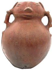
Vasija con cuello cefalomórfico. Cultura Puruhá (300 – 1500 DC) N° de inventario: AAM 05156 Terracota. Proveniencia: Riobamba, Chimborazo