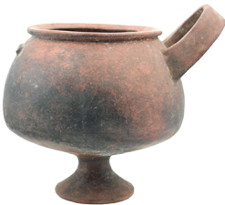
Vasija con pie y un asa de cesta Cultura Inca (1450 – 1532 d. C.) N° de inventario: AAM 05105 Terracota. Proveniencia: sin información.