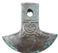
Hacha decorada con una lechuzas Cultura Cañari ((700 a. C. – 1532 d. C.), periodo de integración (700-1450 d. C.) N° de inventario: AAM 05171 Aleación de cobre Proveniencia: Cuenca, Azuay.