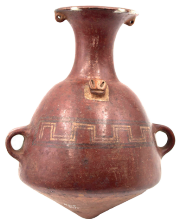
Aríbalo o urpu Cultura Inca (1450 – 1532 d. C.) N° de inventario: AAM 05475 Terracota. Proveniencia: Quingeo, Azuay