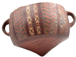
Aríbalo o urpu Cultura Inca (1450 – 1532 d. C.) N° de inventario: AAM 05461 Terracota. Proveniencia: sin información.