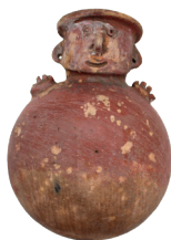
Vasija con cuello cefalomórfico Cultura Cañari (700 a. C. – 1532 d. C.), fase Tacalshapa III (800-1100 d. C.) N° de inventario: AAM 05545 Terracota. Proveniencia: Chordeleg, Azuay.

La cerámica Cañari se distingue por su gran diversidad de formas, asociadas a una decoración relativamente sobria. Se divide en dos tradiciones principales: Tacalshapa y Cashaloma.