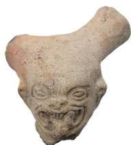
Cabeza de estatuilla con rasgos sobrenaturales Cultura La Tolita-Tumaco (600 a. C. – 400 d. C.) N° de inventario: AAM 00089.2.3 Terracota Proveniencia: sin información.