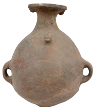
Aríbalo o urpu Cultura Inca (1450 – 1532 d. C.) N° de inventario: AAM 05313 Terracota. Proveniencia: sin información.