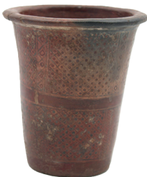
Kero (copa). Cultura Inca (1450 – 1532 d. C.) N° de inventario: AAM 05266 Terracota. Proveniencia: Latacunga, Cotopaxi.