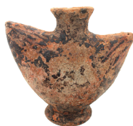
Vasija en forma de media luna Cultura Cañari (700 a. C. – 1532 d. C.), fase Tacalshapa III (800-1100 d. C.) N° de inventario: AAM 05190 Terracota. Proveniencia: Chordeleg, Azuay