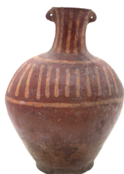
Botella con el vientre aplanado. Cultura Cañari (100 a. C. – 1532 d. C.), fase Cashaloma (1100-1532 d. C.) N° de inventario: AAM 05304 Terracota. Proveniencia: sin información.