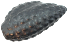
Mazorca de maíz Cultura Inca (1450 – 1532 d. C.) N° de inventario: AAM 05727 Piedra. Proveniencia: Cayambe, Pichincha.