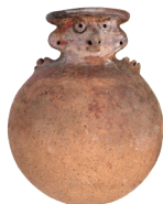
Vasija con cuello cefalomórfico Cultura Cañari (700 a. C. – 1532 d. C.), Fase Tacalshapa III (800-1100 d. C.) N° de inventario: AAM 05486 Terracota. Proveniencia: Chordeleg, Azuay.