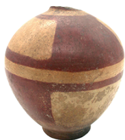
Vasija con decorado geométrico bicromo Cultura Cañari (100 a. C. – 1532 d. C.), fase Cashaloma (1100-1532 d. C.) N° de inventario: AAM 05878 Terracota. Proveniencia: sin información.