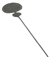
Gran alfiler - Gran tupu Cultura Cañari (100 a. C. – 1532 d. C.), fase Cashaloma (1100-1532 d. C.) N° de inventario: AAM 05754 Aleación de cobre Proveniencia: sin información.

La cultura Cañari, establecida en las tierras altas del centro-sur (principalmente en las provincias de Cañar y Azuay), es un importante complejo cultural. Entre los años 450 y 1532 d. C., los cañaris desarrollaron una metalurgia refinada, trabajando principalmente el cobre, el oro y la plata, sobre todo en forma de aleaciones. Estas producciones proceden en gran parte de tumbas profusamente decoradas, muchas de las cuales fueron desafortunadamente saqueadas. Sin embargo, los pocos objetos conservados dan testimonio de la delicadeza y la riqueza de estas producciones. La presencia de minerales metálicos en la región cañari favoreció los intercambios a larga distancia, especialmente con la costa del Pacífico, que carecía de estos recursos y dependía de las tierras altas para su abastecimiento.