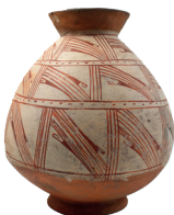
Vasija con motivos geométricos Cultura Panzaleo / Cosanga-Píllaro (300 AC – 1500 DC) N° de inventario: AAM 05294 Terracota. Proveniencia: sin información.